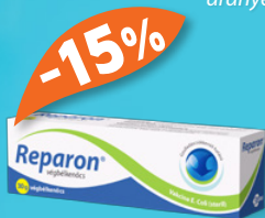
Reparon® végbélkenőcs, 30 g