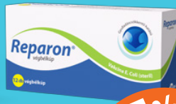
Reparon® végbélkúp, 12 db