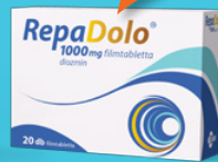
RepaDolo® 1000 mg filmtabletta, 20 db